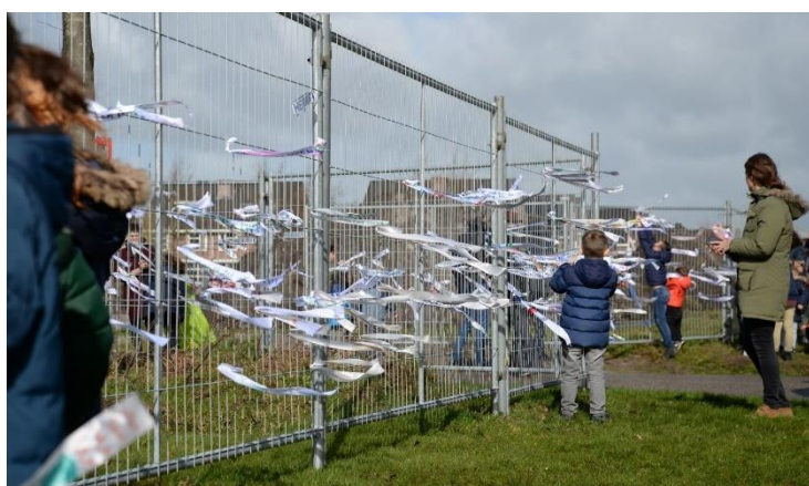
Wensenlinten leerlingen bouwhek