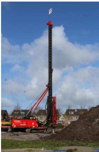
Slaan 1 o paal