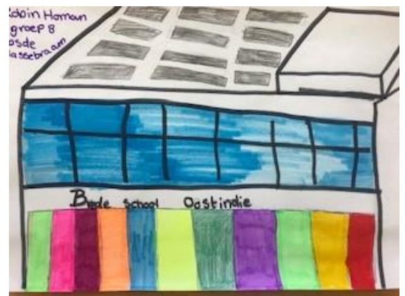
Gemaakt door Edwin