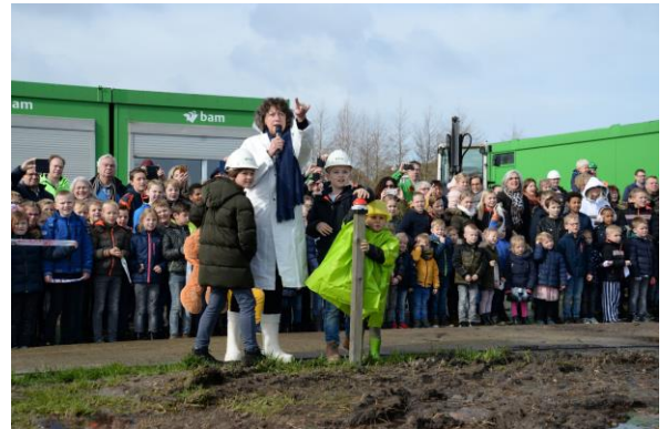
Slaan 1 o paal met wethouder en kinderen