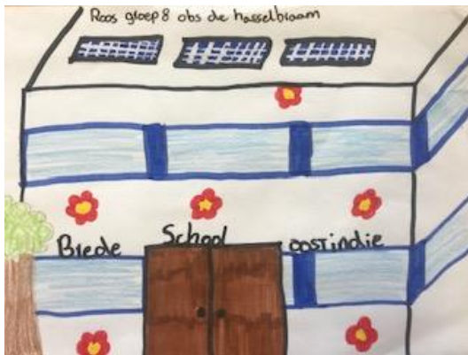
Gemaakt door Roos