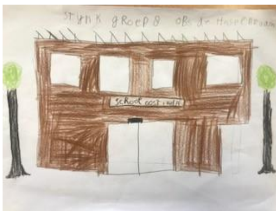
Gemaakt door Stijn