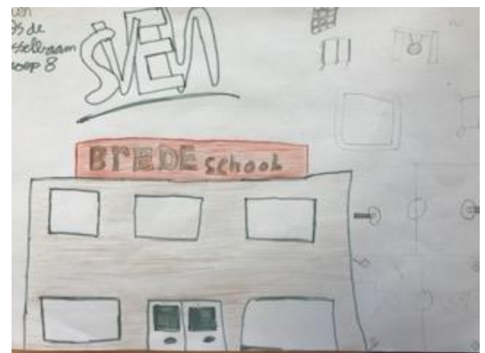
Gemaakt door Sven