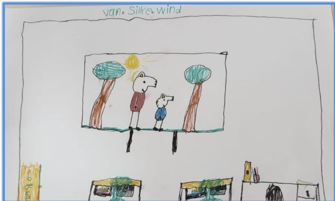
Silke Wind, groep 1 OBS De Springplank